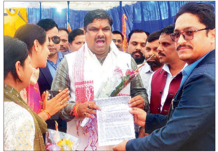
शिक्षार्थी से मिलते शिक्षक।