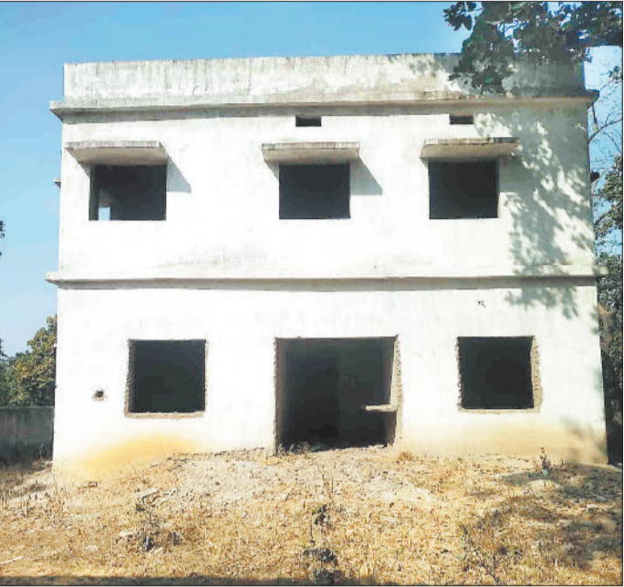
निर्माणाधीन स्वास्थ्य केंद्र भवन।

सूरजपुर जिलान्तर्गत दूरस्थ चांदनी-बिहारपुर क्षेत्र में स्वास्थ्य सुविधाओं का बुरा हाल है। कठिन भौगोलिक परिस्थितियों एवं आवागमन सुविधाओं की कमी के बीच स्वास्थ्य सुविधाओं के लिए गंभीर रूप से बीमार लोगों को सीमावर्ती मध्यप्रदेश के सिंगरौली या फिर जिला मुख्यालय सूरजपुर का सफर करना पड़ रहा है। वर्ष 2018 में ग्राम महली सहित आसपास के गांवों में मलेरिया का प्रकोप होने एवं 21 मलेरिया पीड़ितों की मौत होने पर प्रशासन ने आनन-फानन में ग्राम पंचायत महली में उप स्वास्थ्य केंद्र खोला था। भवन के अभाव में पटवारी आवास में स्वास्थ्य केंद्र प्रारंभ किया गया था। पटवारी आवास में काफी कम जगह उपलब्ध होने के बावजूद स्वास्थ्य केंद्र में उपलब्ध सुविधाओं के अनुसार प्रसव एवं गंभीर रूप से घायल लोगों को उपचार की सुविधा मिल रही थी। वर्ष 2023 में शासन ने उप स्वास्थ्य केंद्र भवन निर्माण की स्वीकृति प्रदान की तथा भवन निर्माण की जिम्मेदारी सीजीएमएससी को सौंप दी।