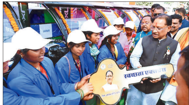
प्रोत्साहन देने के उद्देश्य से 6 आजीविका आजीविका एक्सप्रेस) प्रदान किए गए। दीर्घों को पिक ई-रिक्शा (ग्रामीण मुख्यमंत्री ने कहा कि यह पहल महिलाओं की

मुख्यमंत्री श्री साय ने कार्यक्रम में 105 पात्र हितग्राहियों को प्रधानमंत्री उज्ज्वला योजना के अंतर्गत गैस कनेक्शन प्रदान किए। उन्होंने कहा कि इस योजना से अब इन परिवारों को धुएँ से मुक्ति मिलने के साथ सुरक्षित, स्वच्छ और स्वास्थ्य के अनुकूल रूंधन की सुविधा उपलब्ध होगी, जिससे महिलाओं के जीवन में सकारात्मक परिवर्तन आएगा। इस अवसर पर स्व-रोजगार और महिला सशक्तिकरण को