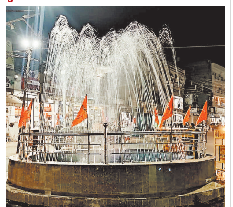
बैकुंठपुर। गर्मी की शुरुआत होने के साथ ही शहर के फव्वारा चौक का फव्वारा चालू हो गया। हालांकि माह के शुरुआत में ही चालू हुआ, लेकिन तब धार कम थी, जिसे ठीक कर दिया गया।