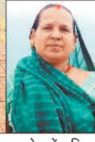
इनसेट में मृतिका